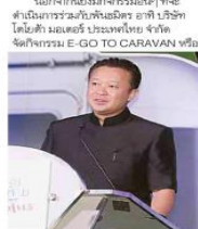
ยุทธศาสตร์ 5

นอกจากนี้ยังมีกิจกรรมอื่นๆ ที่จะ ดำเนินการร่วมไปทั้งเมือง อาทิ บริษัท ได้จัดทำ แผนที่ประเทศไทย จัด จัดกิจกรรม E-GO TO CARAVAN เพื่อ สนับสนุนการเดินทาง