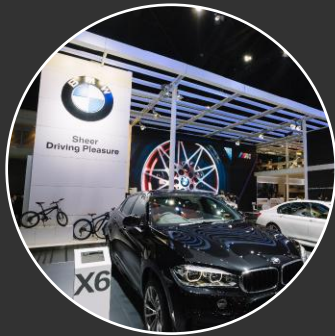
Exhibitions & Events