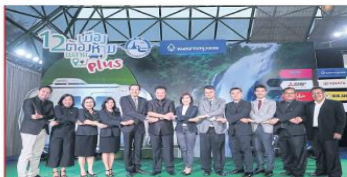
ชวนเที่ยวไทย : ยุทธศาสตร์ 5 ยุทธศาสตร์การท่องเที่ยวแห่งประเทศไทย (ททท.) เป็น ประธานเปิดโครงการ 12 เมืองต้องห้าม...พลาด Plus ปี 2560 กระตุ้นการเดินทาง ท่องเที่ยว ชวนสาธารณชนเที่ยววิถีไทย ชุมชน ปลูกกระแสการเดินทางท่องเที่ยว ในประเทศไทย

นอกจากนี้ยังมีกิจกรรมอื่นๆ ที่จะ ดำเนินการร่วมไปทั้งเมือง อาทิ บริษัท ได้จัดทำ แผนที่ประเทศไทย จัด จัดกิจกรรม E-GO TO CARAVAN เพื่อ สนับสนุนการเดินทาง