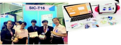
Members of the King Mongkut's University of Technology Thonburi team pose after their robot design, right, won first prize in the Student Innovation Challenge World 2016.