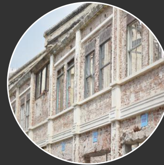
Architecture & Engineering