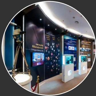
Thematic & Museums