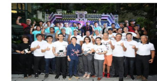
Kingsmen 8 สิงหาคม 2560 "Bangkok Attacker" Thailand's Top Pilot คือศิลปะและความเร็วจากอากาศยานในรูปแบบใหม่ เหล่านี้ถือเป็นการก้าวข้ามขีดความสามารถของโดรนและจากแค่เล่นแข่งประเดิมสนามเท่านั้น