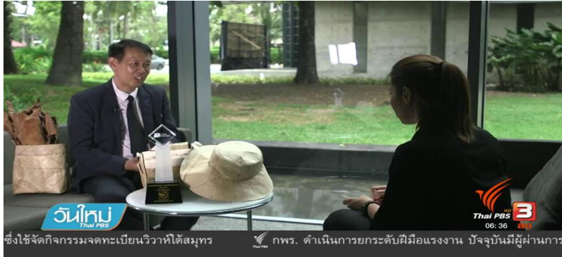
ซึ่งใช้จัดกิจกรรมจดทะเบียนวิสาหกิจได้สมุทร กพร. ตำนานการยกระดับฝีมือแรงงาน ปัจจุบันมีผู้จัดการ