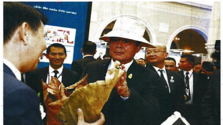
ชื่นชม : พล.อ.ประยุทธ์ จันทร์โอชา นายกรัฐมนตรี เข้มแข็งสินค้าส่งออกผู้ประกอบการ พร้อมยื่นขอความค้ำจ้ำงการฯ ในพิธีมอบ "รางวัลผู้ประกอบการธุรกิจส่งออกดีเด่น ประจำปี 2560" (The 2016 National Export Award) ณ อาคารราชนครินทร์ ชั้น 1 โรงแรมเซ็นทาราแกรนด์ เซ็นทรัลพลาซ่า ลาดพร้าว กรุงเทพฯ เมื่อวันที่ 31 สิงหาคม 2560

กรุงเทพฯ 31 ส.ค. 2560 - บริษัท Kingsmen C.M.T.I. Public Company Limited (Kingsmen) ขอแสดงความยินดีกับ บริษัท BSG Glass ไรวาทกราก สู้องค์กรนวัตกรรม ซึ่งได้รับรางวัล PM Award 2018 สาขาผลิตภัณฑ์กระจกใส